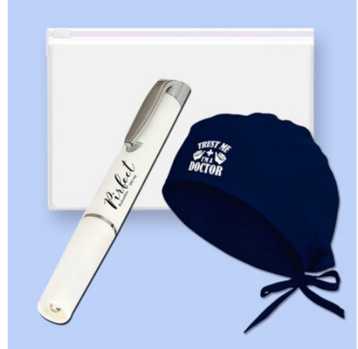
3598 - 3'LÜ DOKTOR SETİ