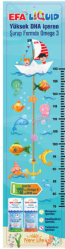
3514 - BOY ÖLÇER