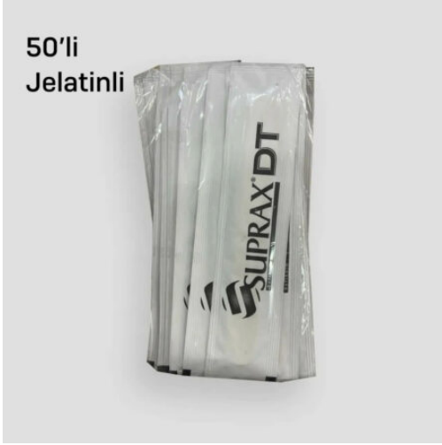
3517 - PEDIATRİK ABESLANG JELATINLI