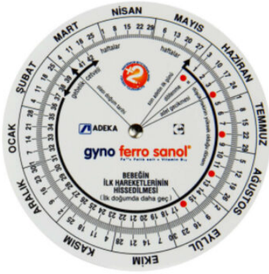
3527 - GEBELİK ÇARKI