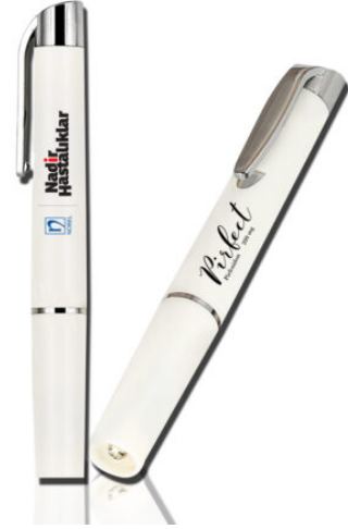
6022 - PENLIGHT