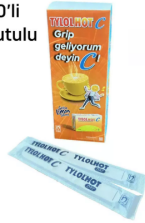
3515 - PEDIATRİK ABESLANG