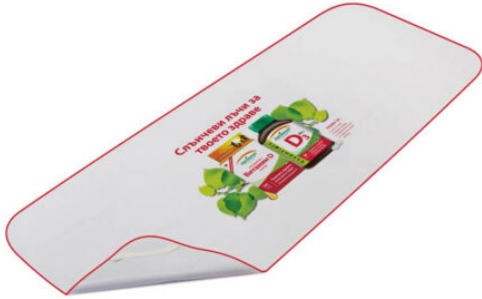
3522 - PVC MUAYENE MASA ÖRTÜSÜ