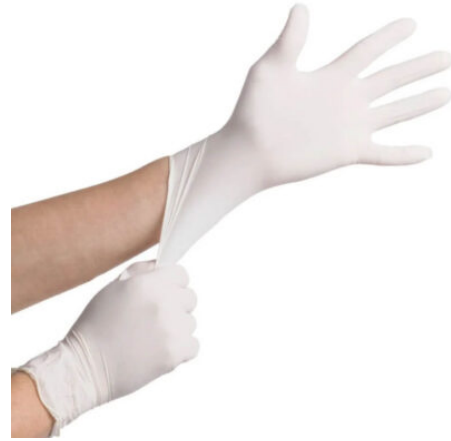
3511 - LATEX PUDRALI ELDIVEN