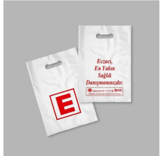
3504 - ECZANE POŞETİ 20X30 CM