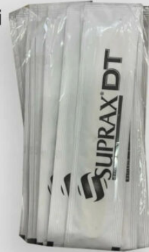
3518 - PEDIATRİK ABESLANG JELATINLI