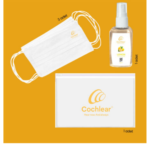
3593 - 3'LÜ HIJYEN SETİ