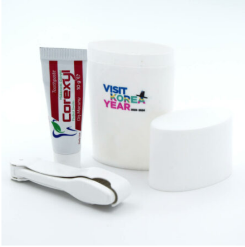
3512 - PROMOSYON DIŞ SETİ