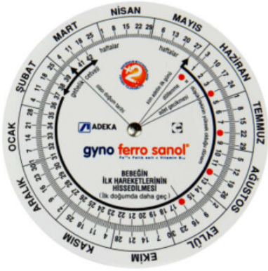
3527 - GEBELİK ÇARKI