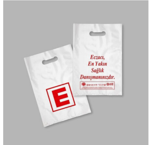
3504 - ECZANE POŞETİ 20X30 CM