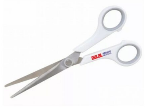
3215 - MAKAS