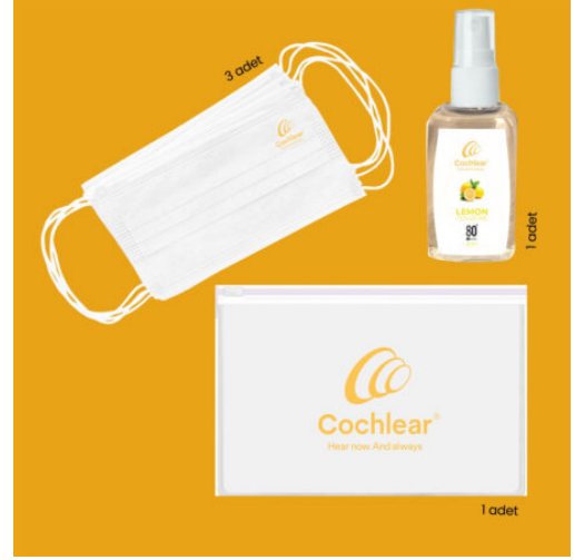
3593 - 3'LÜ HIJYEN SETİ