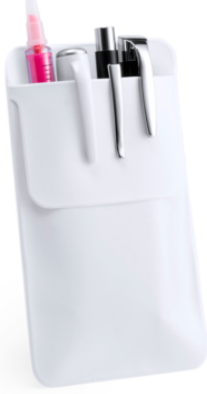
3502 - DOKTOR CEP KALEMLİĞİ