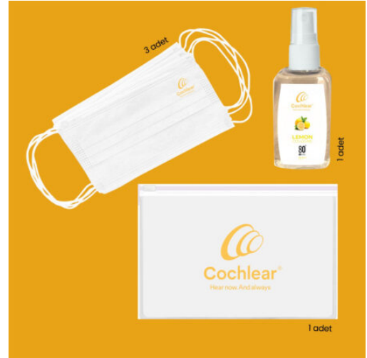
3593 - 3'LÜ HIJYEN SETİ