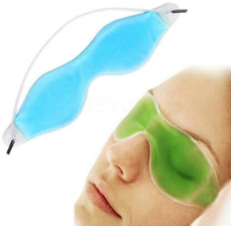
3508 - JEL GÖZ TERAPI MASKESI