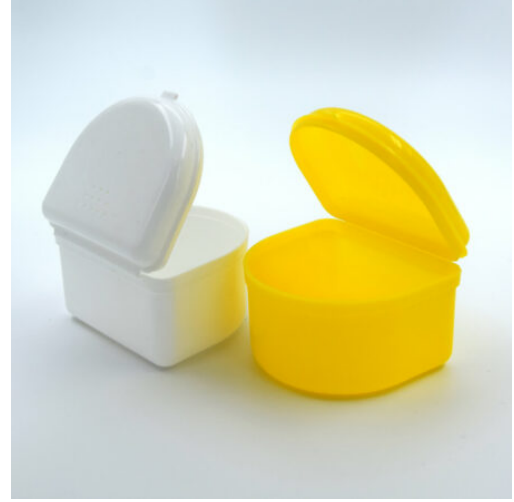
3525 - DIŞ PROTEZ KUTUSU