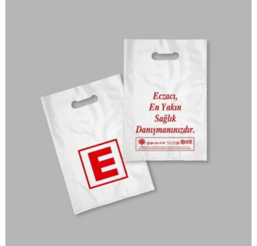
3504 - ECZANE POŞETİ 20X30 CM