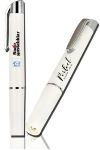
6022 - PENLIGHT