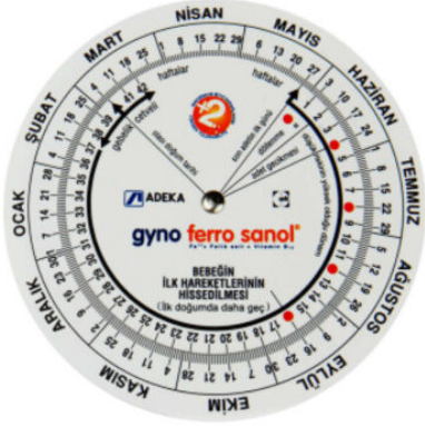
3527 - GEBELİK ÇARKI