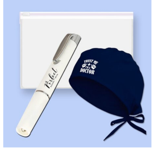
3598 - 3'LÜ DOKTOR SETİ