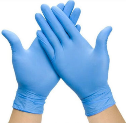
3510 - NITRİL ELDIVEN