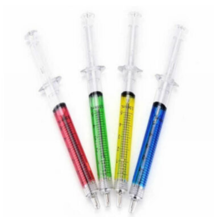
6045 - ŞIRINGA TÜKENMEZ KALEM