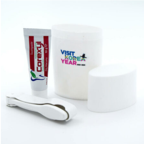
3512 - PROMOSYON DIŞ SETİ