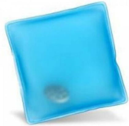
3506 - EL CEP SOBASI