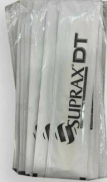
3518 - PEDIATRİK ABESLANG JELATINLI