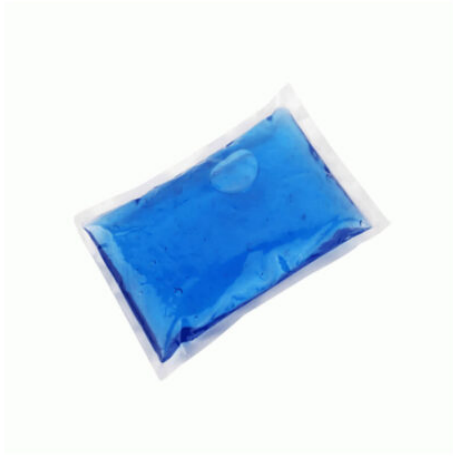
3505 - SOĞUTUCU JEL