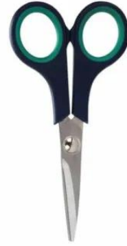
3216 - ECZANE MAKASI