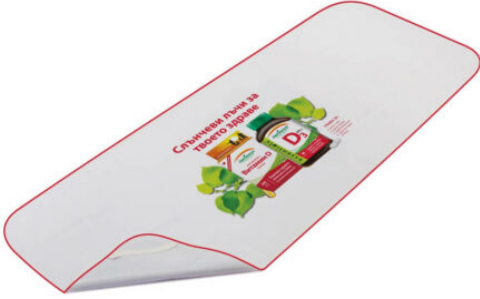
3522 - PVC MUAYENE MASA ÖRTÜSÜ