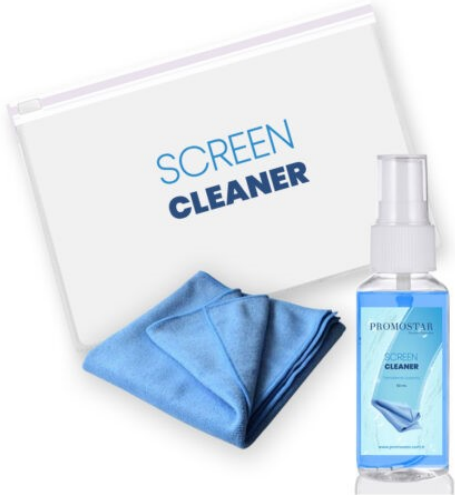
3599 - EKRAN TEMİZLEME KITI