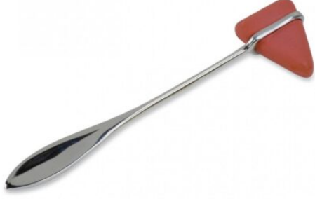
3524 - REFLEKS ÇEKICI