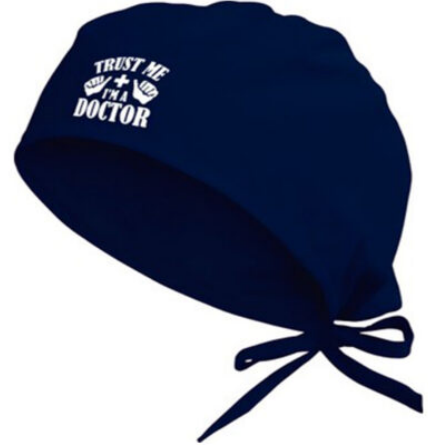
3500 - DOKTOR BONESI