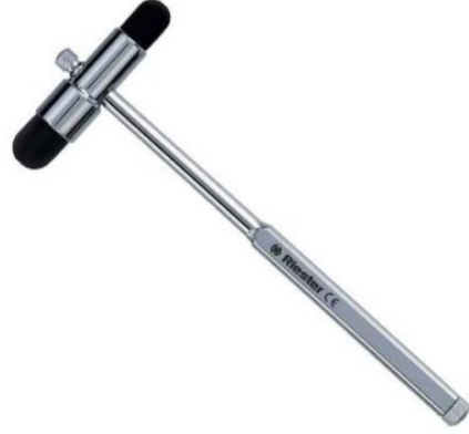
3523 - REFLEKS ÇEKICI