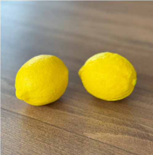
3521 - LIMON STRES TOPU