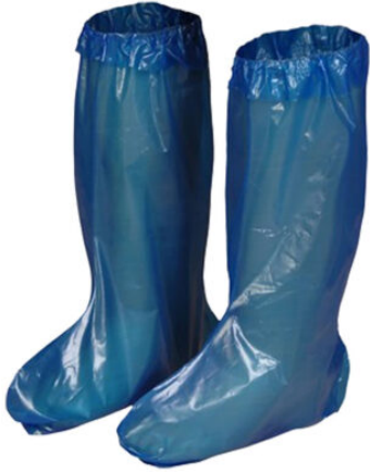
3501 - KULLAN AT ÇIZME