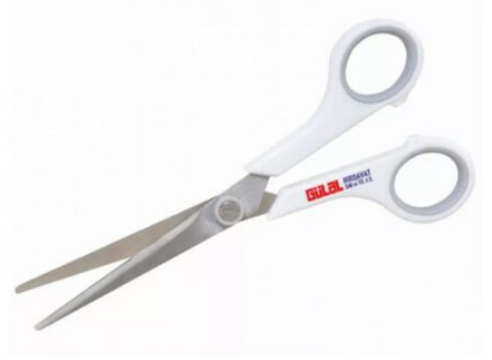
3215 - MAKAS